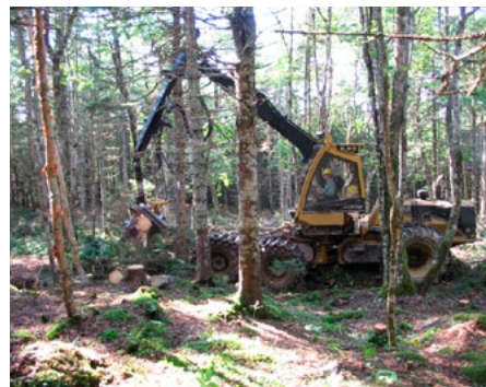
Une abatteuse-façonneuse à tête multifonctionnelle, munie de chenilles ECO-Track pour limiter les dommages au tapis forestier, effectue une récolte sélective dans une forêt au sud-est de Monastery (Nouvelle-Écosse) gérée par la NewPage Port Hawkesbury Corporation. La coupe d'éclaircie laisse pénétrer plus de lumière dans le peuplement, encourageant une régénération accélérée d'espèces de climax comme le pin blanc, l'épinette rouge et le bouleau jaune.

Les principes fondamentaux de pratiques acceptables de gestion forestière sont énoncés dans un ensemble étendu de lois et règlements fédéraux et provinciaux visant la foresterie et des domaines connexes. Il n'est donc pas nécessaire que la norme CSA du Canada reprenne ce cadre. L'objet de la norme CSA et d'autres normes est de définir un moyen de mesurer les pratiques des entreprises forestières à partir de critères reconnus nationalement et internationalement pour la gestion forestière durable, et définis par des organisations non gouvernementales réputées. Autre aspect important, la norme CSA s'inscrit en complément des lois et règlements pertinents en soulignant qu'ils doivent être respectés, et qu'aucun abattage non autorisé ne doit être permis, pour ainsi renforcer leur application.